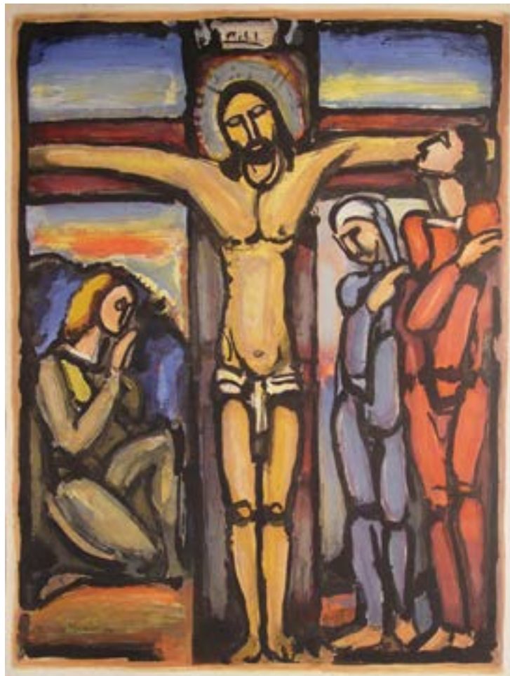
Georges Roualt, "Le Christ en Croix" 1925

CELEBRATION OF THE PASSION OF THE LORD CELEBRACIÓN DE LA PASIÓN DEL SEÑOR